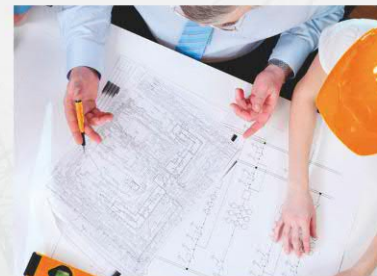
Разработка исполнительной документации