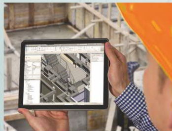
BIM - технологии