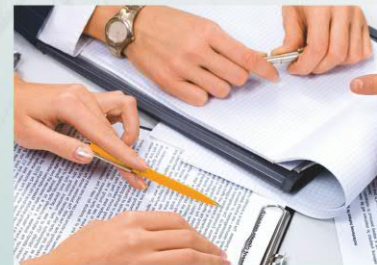
Представление информационно- аналитических материалов