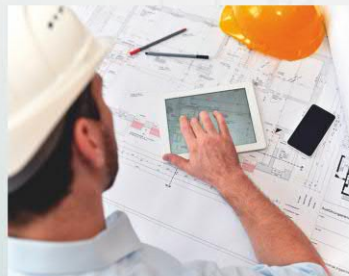
Разработка организационно- технологической документации